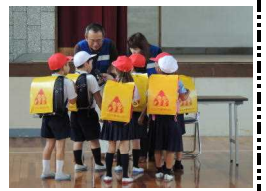
【助けを求めて、110番の家へ】

笠岡警察署生活安全課の方から、不審者に遭遇したときの対応の仕方についてDVDを視聴したり、説明を聞いたりしました。また、警察協力員の方もご参加くださり、実際に不審者から声をかけられた場面を想定した訓練も行って、回避行動の取り方を学んだり防犯意識を高めたりしました。いざというときには、『ついていかない、のらない、おごえをだす、すぐにげる、しらせる』の言葉を思い出して、実践できるようになってほしいと思っています。