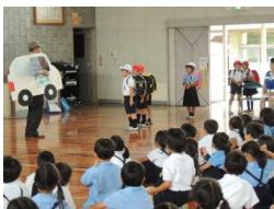
【不審者に声をかけられ・・・】

笠岡警察署生活安全課の方から、不審者に遭遇したときの対応の仕方についてDVDを視聴したり、説明を聞いたりしました。また、警察協力員の方もご参加くださり、実際に不審者から声をかけられた場面を想定した訓練も行って、回避行動の取り方を学んだり防犯意識を高めたりしました。いざというときには、『ついていかない、のらない、おごえをだす、すぐにげる、しらせる』の言葉を思い出して、実践できるようになってほしいと思っています。