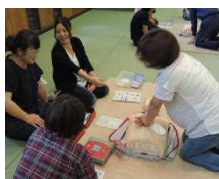
【講習を熱心に受ける幹事さん】

PTA 幹事会に引き続いて、AED を使った心肺蘇生法について笠岡消防署員の方から講習を受けました。実際の場面を想定した講習でしたので、いざという場面でも、冷静に、迅速かつ適切に対応できるようになっ