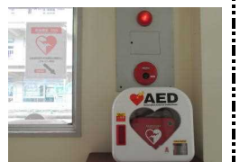
【AED：校長室前の廊下に常設】

と思います。PTA役員及び厚生部の皆様には夏休み中のプール監視では大変お世話になります。ご協力をよろしくお願いたします。なお、いつもはAEDは校長室前の廊下に常設していますが、夏休みのプール開放時は、プールへAEDを持って行くようにしています。