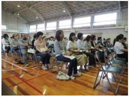
【講師の話に熱心に耳を傾ける参加者】

先日の日曜参観日には大勢の方にお越しいただき、ありがとうございました。お子様の学習の様子はいかがだったでしょうか？子どもたちは、がんばっている姿を見てもらおうと、普段よりも意欲的に学習に取り組んでいたように感じました。がんばっていたことは小さなことでもほめ、気になったことがあれば、話を聞いた上で今後の意欲づけとなるようにアドバイスをさせていただけたらと思っています。