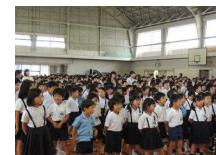
【美しい歌声が響き渡った斉唱】