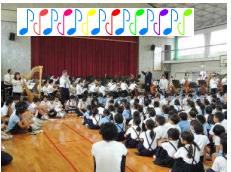
【楽団と共演を楽しむ6年生】

今回、プロの演奏に心が揺さぶられ、自分も楽器を習いたい、中学生になったら吹奏楽部に入りたい、将来演奏家になりたいと思った子どもがいたのではないかと思います。子どもたちにとって、いつまでも記憶に残る貴重な体験になったことと思います。