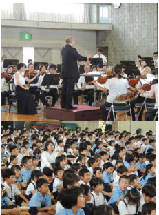
【美しい音色にうっとりする子どもたち】

「文化芸術による子どもの育成事業」の一環として、広島交響楽団からおおよそ70名の演奏家の方にお越しいただきました。この事業は、一流の文化芸術団体が小・中学校で公演し、子どもたちが優れた舞台芸術を鑑賞することで、将来の芸術家の育成や芸術鑑賞能力の向上につなげることを目的としています。