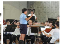
【様々な体験に心が弾む子どもたち】