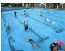
【基礎からみっちり練習】

放課後に、3年生から6年生の児童が自主的に参加して、一生懸命練習に取り組んでいます。自分の目標に向かって、努力を続けている姿はとても頼もしく感じます。しんどい練習を続けることで、泳力や体力がつくと共に、たくましい精神力を養うことができます。最後まであきらめずに、がんばって!