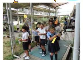
【祈りを込めて笹に飾り付け】

ひかり・こだま学級が、計画して、七夕飾りをしました。全校児童に呼びかけると、早速に大勢の児童が自分の願いを思い思いに短冊に書いて、笹に飾っていました。短冊には、勉強に関することや買ってほしいもの、将来なりたいことに関する内容が多かったように思います。その中で、中学年の児童が自分の願いと共に、「みんなの願いがかないますように」と書いた短冊が目にとまりました。自分のことだけでなく、友達みんなの幸せも願っている児童がいることに感動しました。一人一人の願いが叶うことを祈りたいと思います。