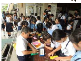
【願いを込めて短冊へ】

ひかり・こだま学級が、計画して、七夕飾りをしました。全校児童に呼びかけると、早速に大勢の児童が自分の願いを思い思いに短冊に書いて、笹に飾っていました。短冊には、勉強に関することや買ってほしいもの、将来なりたいことに関する内容が多かったように思います。その中で、中学年の児童が自分の願いと共に、「みんなの願いがかないますように」と書いた短冊が目にとまりました。自分のことだけでなく、友達みんなの幸せも願っている児童がいることに感動しました。一人一人の願いが叶うことを祈りたいと思います。