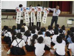
【いざというときは「いかのおすし!」】

1年生は防犯教室、2年生と4年生と6年生は、非行防止教室を実施しました。これから夏休みに入る子どもたちが、事故や事件の被害に遭わないように、また健全な生活を送ることができるように、笠岡警察署員の方から指導していただきました。1年生は、不審者に遭遇したときの対応の仕方について、2・4・6年生は、決まりを守るとはどういうことか、どんなことが非行や犯罪になるのか、どのように行動したらよいかなどについて、学年の発達段階に応じて、クイズやDVD視聴、