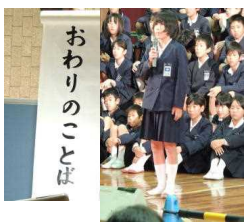
〔児童会議長あいさつ〕