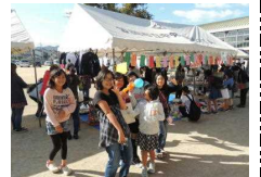
【文化祭を楽しむ小学生】

24日・25日に行われた笠岡東公民館の文化祭に、各学年から児童の硬筆・習字、図画工作を出品しました。ご覧いただけただけでしょうか。子どもや大人が努力して完成させた秀作を鑑賞することは、子どもの豊かな感性を磨いていくうえで、とても大切なことです。今後も地域の行事に、子どもを積極的に参加させていただけたらと思っています。