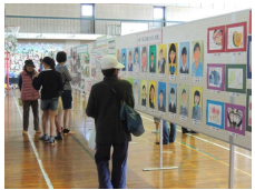
【見学者を魅了した児童の作品】