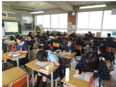
【集中して朝チャレに取り組む6年生】

子どもたちの学力の向上を目指して、本校の教員も日々指導力の向上に努めています。学年団を中心に指導方法について意見交換をしたり、外部講師を招いて授業研究を行ったりしています。絶え間ない研鑽を積んでいくことで、子どもたちが「わかる」「できる」喜びを実感できる授業にしていきたいと思っています。今年度は、「基礎・基本を大切に、生き生きと学習に取り組む児童の育成」をテーマに研修を進めています。子どもたちの学力を身に付けていくためには、基礎・基本の定着、学習習慣や基本的生活習慣の確立がキーワードに【研究授業を通して互いの授業力アップ!】なると思っています。保護者の皆様のご協力をよろしくお願いいたします。