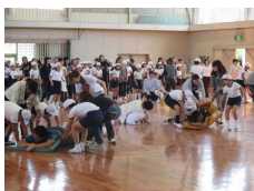
【先生乗ってレッツゴー】