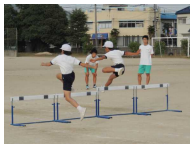
【中学生に見守られて】