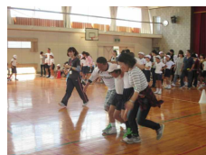
【足並みそろえてレッツゴー】