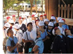
〔金剛力士像の迫力に圧倒される子どもたち〕