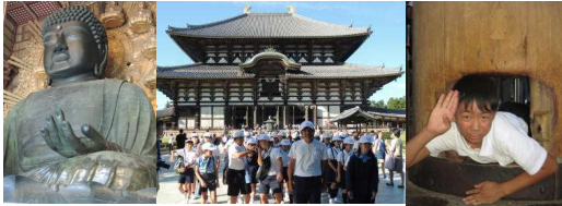
〔でっけえ〜盧舎那仏〕〔大仏様に圧倒されたご一行様〕〔柱の穴くぐりで聡明に!〕