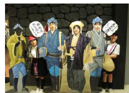
〔黄門様ご一行 映画村へ〕