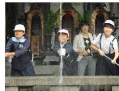
〔願いを込めて：音羽の滝〕