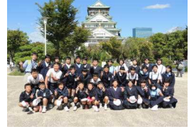
〔大阪城でカプトガニ〜〕