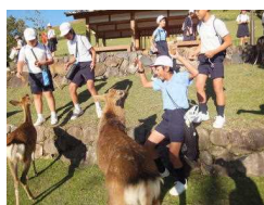
〔鹿と戯れる子どもたち：若草山〕