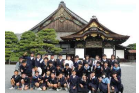
〔二条城でカプトガニ〜〕