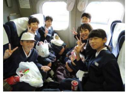
〔おやつをほおばりながら上機嫌〕