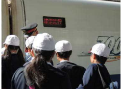
〔専用列車・新幹線で新大阪駅〕