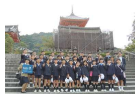
〔清水寺山門前でカプトガニ〜〕