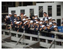
〔清水寺の舞台上立つ：残念! 清水寺改修中〕〔舞台から京都タワーを望む〕