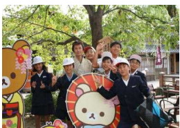
〔江戸時代ヘタムスリッパ〕