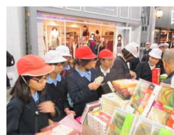
〔夜の新京極でウキウキお買い物〕