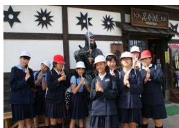
〔忍者に変身 はいポーズ!〕