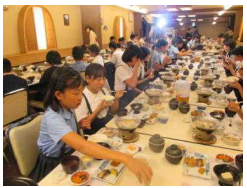
〔京料理に舌鼓：秀峰閣〕