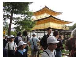
〔金閣寺を眺めながら移動中〕