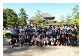
〔東大寺でカプトガニ〜〕