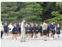
〔大政奉還の説明に耳を傾ける〕