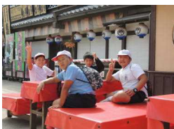
〔茶屋で一服 はいポーズ!〕