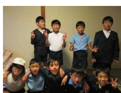
〔部屋でくつろぎタイム〕