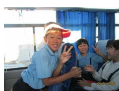
〔車中で思い出づくり〕