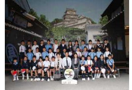
〔映画村でカプトガニ〜〕