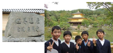
〔外国人がいっぱい金閣寺〕