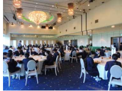
〔KKRホテルでマナーよく昼食?〕