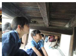
〔ウグイス張りの仕組み、な〜るほど?!〕